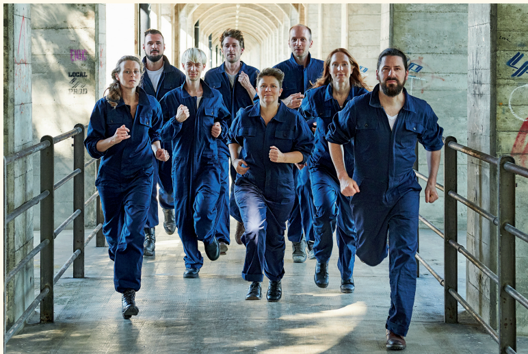
Ensemble Proton Bern